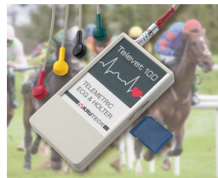
Telemetric ECG system for veterinary medicine