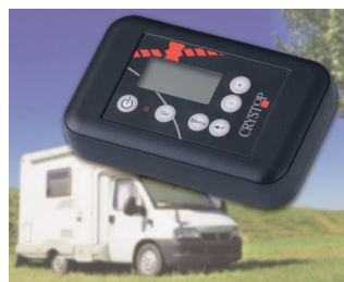
Remote control unit for AutoSat satellite receiver