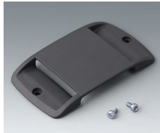
B9106128 Strap eyelet ABS (UL 94 HB) lava