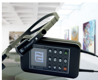
Multimedia audioguide for museums