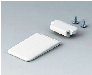
A9152057 Tilt foot bar ABS (UL 94 HB) off-white RAL 9002