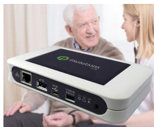
Real-time localisation in the healthcare sector