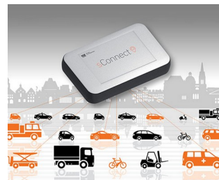
Module for smart mobility applications