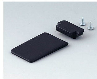
A9152059 Tilt foot bar ABS (UL 94 HB) black RAL 9005

Subject to technical modification without notice.