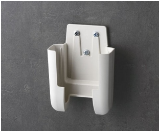
A9105627 Holder S ASA+PC (UL 94 V-0) off-white RAL 9002