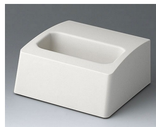
A9106507 Station M ASA+PC (UL 94 V-0) off-white RAL 9002