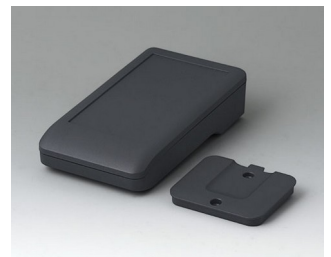
A9005218 DATEC-COMPACT S ASA+PC (UL 94 V-0) lava 136x74x32mm IP 41