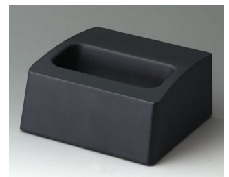
A9106508 Station M ASA+PC (UL 94 V-0) lava