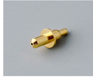
A9193031 Spring contact gold-plated