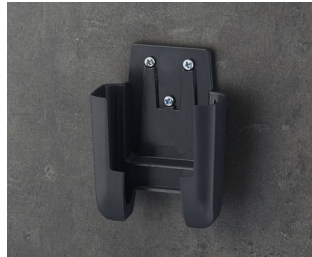
A9105628 Holder S ASA+PC (UL 94 V-0) lava