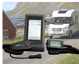
System for leak detection in leisure vehicles