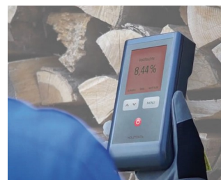
Wood moisture measuring device