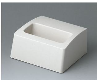
A9105507 Station S ASA+PC (UL 94 V-0) off-white RAL 9002