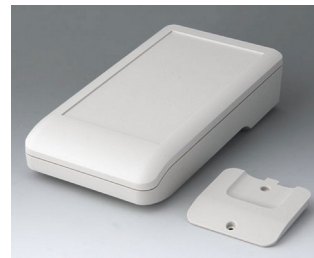
A9007217 DATEC-COMPACT L ASA+PC (UL 94 V-0) off-white RAL 9002 206x110x47mm IP 41