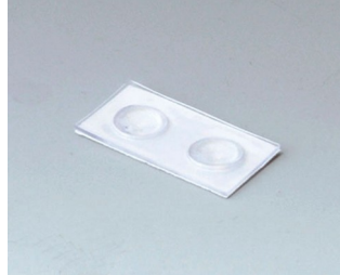
A9207150 Anti-slide feet 6.5 x 2 mm transparent

Subject to technical modification without notice. © by OKW Gehäusesysteme, Buchen/Germany.