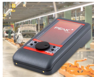
Mobile diagnostic device for CAN and CAN FD buses