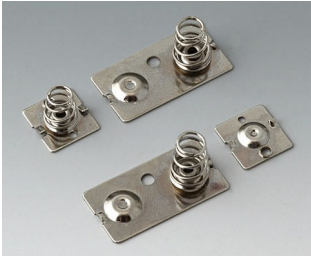
A9190023 Set of battery clips, 3 x AA Steel nickel-plated