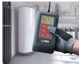
Measuring device for heating water