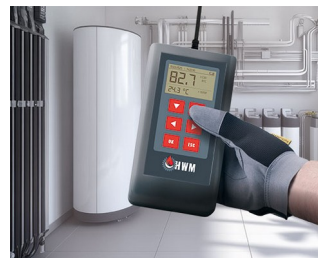
Measuring device for heating water