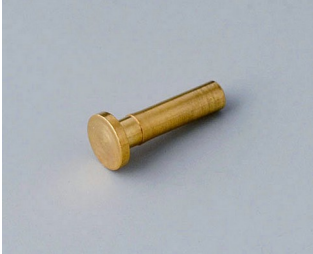
A9193030 Contact pin gold-plated