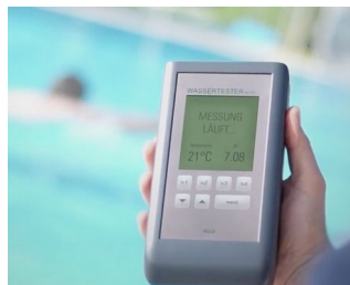
Electronic pool tester