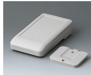
A9005217 DATEC-COMPACT S ASA+PC (UL 94 V-0) off-white RAL 9002 136x74x32mm IP 41