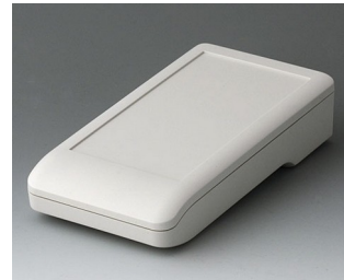
A9006117 DATEC-COMPACT M ASA+PC (UL 94 V-0) off-white RAL 9002 172x92x39mm IP 41