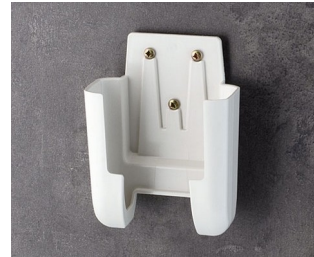
A9106627 Holder M ASA+PC (UL 94 V-0) off-white RAL 9002