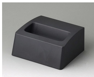
A9105508 Station S ASA+PC (UL 94 V-0) lava