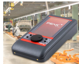
Mobile diagnostic device for CAN and CAN FD buses