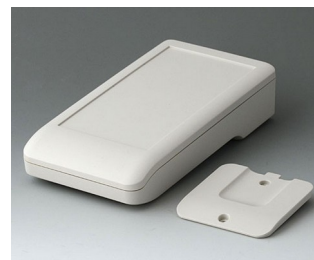
A9006217 DATEC-COMPACT M ASA+PC (UL 94 V-0) off-white RAL 9002 172x92x39mm IP 41