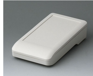
A9005117 DATEC-COMPACT S ASA+PC (UL 94 V-0) off-white RAL 9002 136x74x32mm IP 41