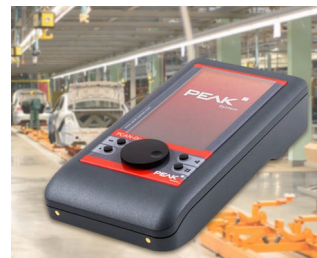
Mobile diagnostic device for CAN and CAN FD buses