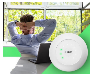
CO2 sensor traffic light