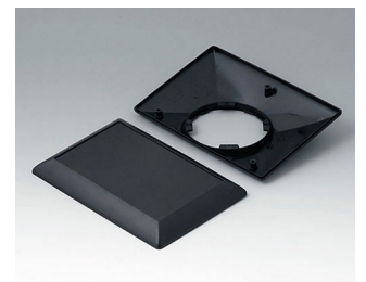
B5017209 Bottom and top part E160 F ABS (UL 94 HB) black RAL 9005 160x110x38mm