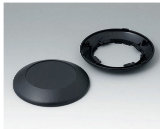
B5010009 Bottom and top part R110F ABS (UL 94 HB) black RAL 9005 ø110x30mm