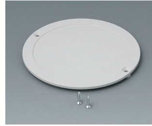
B5011847 Lid ABS (UL 94 HB) off-white RAL 9002