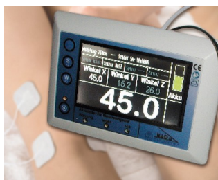
3D angle measurement of articulation systems on a gravity basis

Ideální pro vnitřní použití v elektronických aplikacích. Např.: vysílací a přijímací jednotky v budovách a domácnostech, dále v oblasti zdravotnických technologií, počítačových periférií, síťových technologií, bezpečnostních technologií, atp.