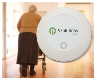
Access management in care facilities