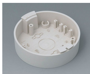
B5011117 Base ABS (UL 94 HB) off-white RAL 9002