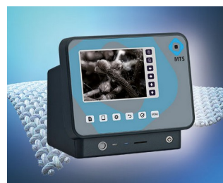
Material analysis in R&D and for damage analysis