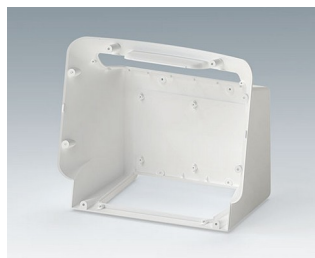
C3602707 COMMUNITEC S, basic housing ASA+PC (UL 94 V-0) traffic white RAL 9016 280x169x242mm IP 40