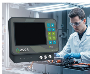
Testing device for battery systems