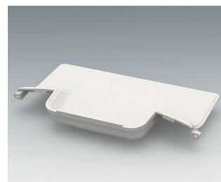
C3602607 Handle recess panel ASA+PC (UL 94 V-0) traffic white RAL 9016