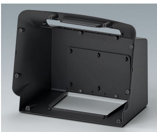
C3604708 COMMUNITEC M, basic housing ASA+PC (UL 94 V-0) anthracite grey RAL 7016 340x194x273mm IP 40