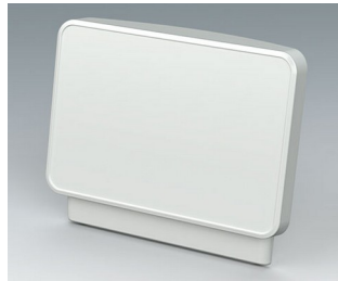
C3604407 Operating panel M ASA+PC (UL 94 V-0) traffic white RAL 9016 328x78x275mm