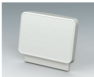
C3602407 Operating panel S ASA+PC (UL 94 V-0) traffic white RAL 9016 284x68x244mm