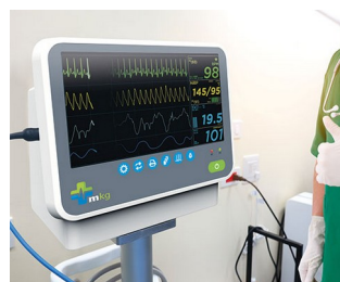
Patient monitoring system