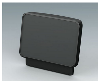
C3602408 Operating panel S ASA+PC (UL 94 V-0) anthracite grey RAL 7016 284x68x244mm