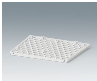
C3602807 Bottom panel ASA+PC (UL 94 V-0) traffic white RAL 9016 188x150x5mm