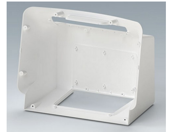
C3604707 COMMUNITEC M, basic housing ASA+PC (UL 94 V-0) traffic white RAL 9016 340x194x273mm IP 40