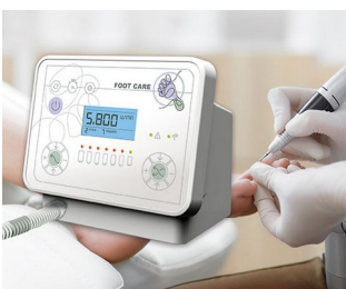
Foot care device

Zdravotnická technika, např. pro monitorování pacientů, diagnostiku a dohled, jako ventilátory (přístroje pro umělou plicní ventilaci), neuromonitoring a mnoho dalšího. Estetická medicína, např. laserové ošetření, péče o nohy a aplikace IPL (Intense Pulsed Light). Univerzální měřicí a zkušební přístroje v laboratořích, zkušební technice, automatizaci atd. Pro analýzu poruch a kontrolu kvality. Osciloskopy se širokým rozsahem funkcí.