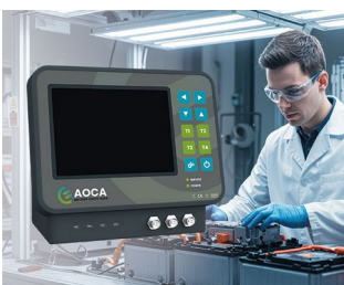
Testing device for battery systems