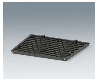
C3602808 Bottom panel ASA+PC (UL 94 V-0) anthracite grey RAL 7016 188x150x5mm