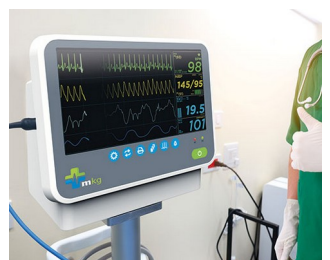
Patient monitoring system