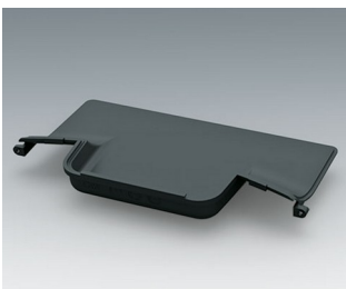
C3602608 Handle recess panel ASA+PC (UL 94 V-0) anthracite grey RAL 7016