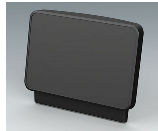
C3604408 Operating panel M ASA+PC (UL 94 V-0) anthracite grey RAL 7016 328x78x275mm