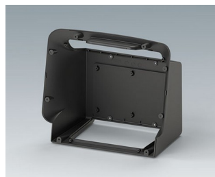
C3602708 COMMUNITEC S, basic housing ASA+PC (UL 94 V-0) anthracite grey RAL 7016 280x169x242mm IP 40