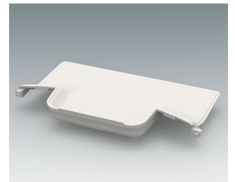
C3602607 Handle recess panel ASA+PC (UL 94 V-0) traffic white RAL 9016