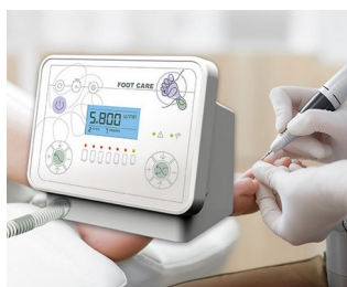
Foot care device

Zdravotnická technika, např. pro monitorování pacientů, diagnostiku a dohled, jako ventilátory (přístroje pro umělou plicní ventilaci), neuromonitoring a mnoho dalšího. Estetická medicína, např. laserové ošetření, péče o nohy a aplikace IPL (Intense Pulsed Light). Univerzální měřicí a zkušební přístroje v laboratořích, zkušební technice, automatizaci atd. Pro analýzu poruch a kontrolu kvality. Osciloskopy se širokým rozsahem funkcí.